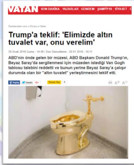
Resim 2: Gazete Haberi

Bu meraklarla internette kısa bir arama yapan sanatseverler oldukça çarpıcı bir başka durumla karşılaştılar: Zira eser işlevsel durumda olan ve herkes tarafından rahatça kullanılabilen altın bir klozetti.