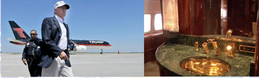
Resim 6: Donald Trump’ın özel uçağı ve 24 ayar altın kaplamalı banyosu

Medyada sıkça boy göstermeye başladıktan sonra insanlar Trump’ın aşırılıklarına da tanık olmaya başladılar. Adaylığı ve Başkanlığı sürecinde özel hayatı ile sıkça gündeme gelen Başkan Trump’ın altın armatürlü banyolu özel uçağı gerçekten Cattelan’ın “America” sını kıskandıracak gösteriştir (Resim 6).