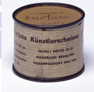
Resim 4: Piero Manzoni " Artist's Shit ", 1961

Klozeti bir sanat eserine dönüştüren sanatçı eserini insanların kullanımına açarak bir anlamda boşaltma eylemini de sanatsal bir performansa dönüştürüyor. Önünde saatlerce kuyrukta bekleyen bu katılımcılar idrar torbalarında ve bağırsaklarında beklettikleri atıklarını bu nadide esere bırakırlarken ne düşünüyorlar bilinmez ama bu düşünce akıllara 1961 tarihli Piero Manzoni'nin dışkı kutularını getirmektedir (Resim 4). Manzoni'de tıpkı Cattelan gibi provokatif bir İtalyan sanatçıdır. Kapitalist tüketimin her şeyi alınıp satılır bir pazarlama nesnesine dönüştürdüğü çağımız içinde ironik bir sanat nesnesi olarak karşımıza çıkan " Manzoni's Shit " sanat ve sanatçı üzerindeki bütün geleneksel tanımları ve beklentileri yerle bir etmiş ve tam da arzu ettiği huzursuzluğa sebebiyet vererek, gittikçe zenginleşen ve tüketim toplumuna dönüşen İtalya'nın kapitalist alışkanlıklarına sanatsal bir saldırı düzenlemiştir.