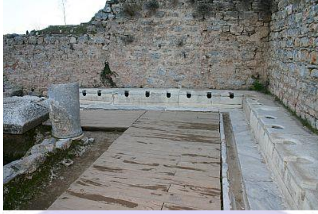
Resim 1: Latrina, Efes

Erişim Adresi: http://www.ephesus.us/ephesus/latrines.htm