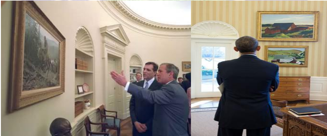
Resim 7: Başkan Bush Beyaz Saray’da W.H. Koerner’in tablosu önünde.

Daha önce de Amerika Başkanlarının Beyaz Saray’da bazı yapıtları görmek arzuları olduğu bilinmektedir. Örneğin Başkan Ronald Reagan Calvin Coolidge’in bir portresini kabinde görmek istemiştir. Başkan George W. Bush ise W.H. Koerner’e ait bir kovboy çalışmasını “Hristiyan Beyaz Kovboy” imajını kendisi ile özdeşleştirdiği için Oval Ofis’e astırmıştır. Başkan Barack Obama ise, Amerikan Whitney Sanatı Müzesi’nden ödünç aldığı iki Edward Hopper tablosu ile bilinir (Resim 7-8).