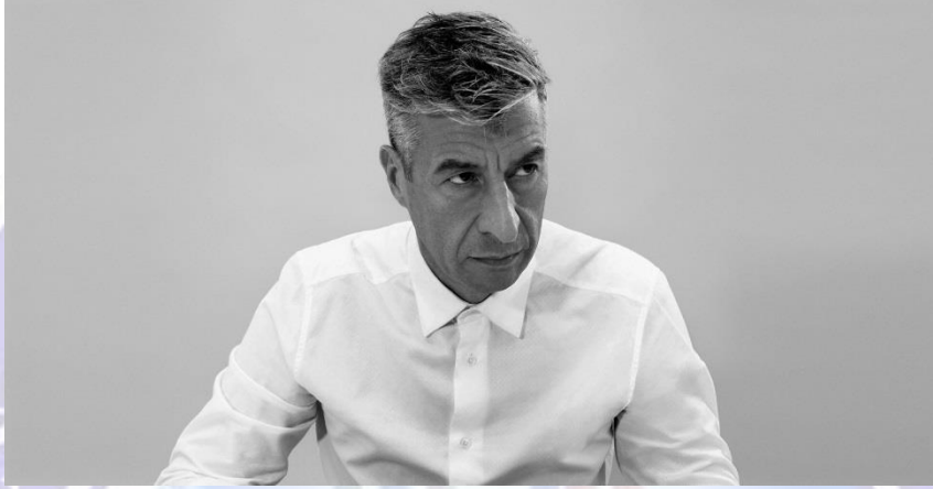
Resim 5: Maurizio Cattelan

1960 doğumlu Maurizio Cattelan'ın sanat hayatına geçişi de tıpkı eserleri gibi oldukça sıradışıdır (Resim 5). Daha öncelerde geçinebilmek için açıcılık, hastabakıcılık, postacılık, temizlikçilik, cenaze işleri gibi hizmetlerde çalışan sanatçı daha iyi bir hayat yaşamak adına sanata yönelir. 80' lerde yaptığı mobilya tasarımları ile sanat hayatını başlatır.