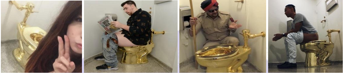
Resim 3: Müzede "America" yı kullanırken hatıra fotoğrafı çektiren ziyaretçiler

"Amerika" Müze'deki diğer tuvaletler gibi binanın beşinci katında sergilenmekte ve izleyicilere hizmet vermektedir. Bir sanat eserinin içine insanların ihtiyacını gidermek fikri ne kadar garip gelse de Cattelan bu durumu "eserin test edilmesi" olarak değerlendirmektedir. 3 (Resim 3).