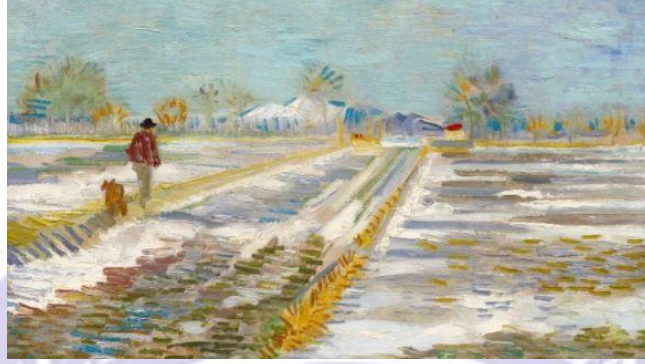
Resim 9: Trump'ın istediği Van Gogh tablosu

Trump'da bu geleneği sürdürerek Beyaz Saray için Solomon R. Guggenheim Müzesi'nden Van Gogh'un " Karlı Manzara " isimli çalışmasını ister (Resim 9). Eserde beyaz bir kar manzarasında yürüyen küçük bir figür yer alır.