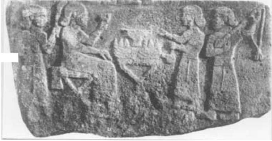
Şekil 3: Kargamış Orthostatı