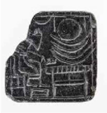
Şekil 8: Damga Mühür

Zincirli kolye ucunda ve Hatay Çatalhöyük'te bulunan damga mühürde tek başına oturan figürlerin ziyafet sahneleri bulunur (Şekil 8, 9). Zincirli kolye ucunda bir elinde lotus çiçeği bulunan erkek figürü çapraz ayaklı ziyafet masasının önünde oturmaktadır. Masanın üzerinde üst üste dizilmiş pideler bulunur. Hatay Çatalhöyük'te bulunan damga mühürde de benzer sahne görülür. Elinde kâse tutan erkek figürü ziyafet masasının önünde oturmaktadır. Masada üst üste dizilmiş ay biçimli pideler yer alır.