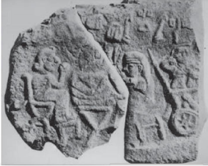
Şekil 6: Malatya Orthostatı