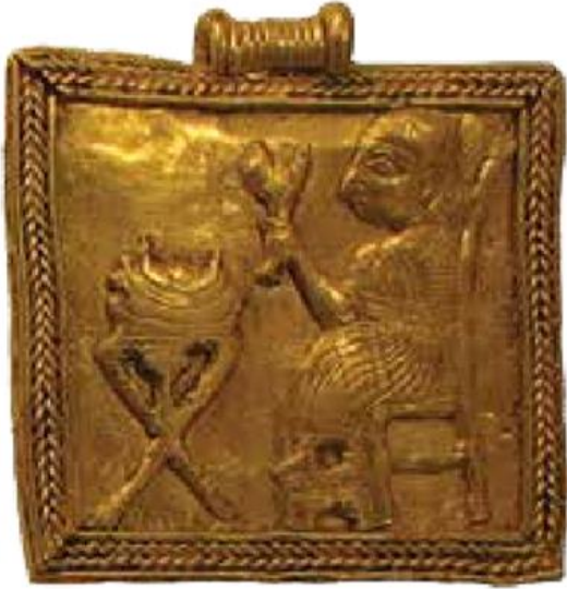
Şekil 9: Zincirli Kolye Ucu