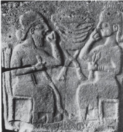
Şekil 7: Zincirli Orthostatı

Zincirli’de stadel/iç kalesi güney kapısında yer alan yemek sahnesinde, karşılıklı oturmuş figürler, muhtemelen kral ve kraliçedir (Orthmann 1971: 376; Darga, 1992: 256) (Şekil 7). Orthostatın solundaki sakallı erkek figürü bir elinde asa tutarken diğer eli ağız hizasında kadeh tutmaktadır. Sağdaki kadın figürü ise bir elinde haşhaş demeti tutarken (Orthmann, 1971: 376) yukarı kaldırdığı diğer elinde de kadeh tutar.