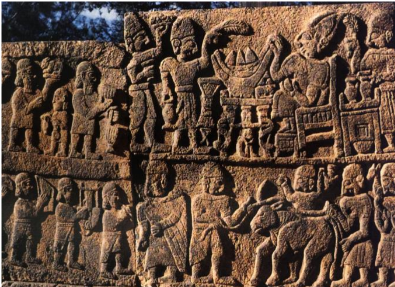
Şekil 4: Karatepe Törenselsel Ziyafet

Kralın karşısında ve arkasında bir ellerinde hurma dalından yelpaze, diğer ellerinde içki testileri tutan iki hizmetkâr vardır. Kralın karşısından masaya doğru servis için yiyecek ve içecek taşıyan diğer görevliler gelmektedir.