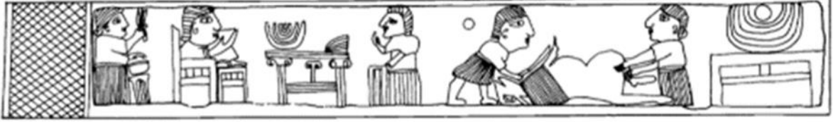
Şekil 5: Taş Kap Pyxis

Karatepe ziyafet sahnesine benzeyen Tell Tayinat'ta bulunmuş taş pyxis üzerinde törensel ziyafet sahnesi görülür (Şekil 5). Taş pyxis 'in sol tarafında arkalıklı bir taht üzerinde, yüksek bir ayaklığa basar şekilde, muhtemelen bir kral oturmaktadır. Kral, yukarı kaldırdığı sağ elinde kadeh tutmaktadır. Önündeki ziyafet masasının bir tarafından üst üste ay biçimli pideler diğer tarafında farklı yiyecekler görülür. Kralın önünde ve arkasında hizmetliler bulunur.