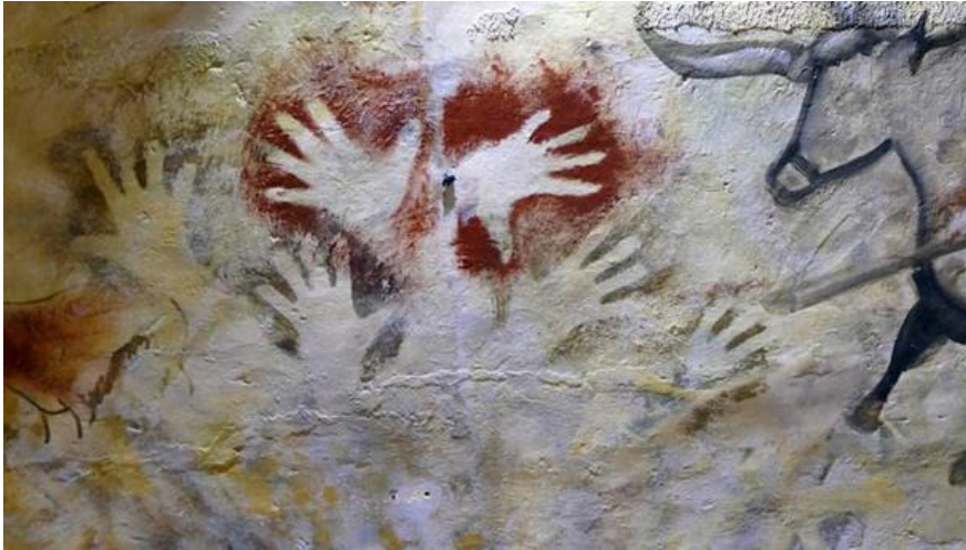
Görsel 9. Altamira mağarasındaki el şablonları

19. yüzyılın sonlarında keşfedilen Kuzey İspanya'daki Altamira Mağarası, tarih öncesi resimlerin keşfedildiği ilk mağaradır. Altamira Mağarası'ndaki at, bizon ve el izlerinin (Görsel 9.) karakalem ve toprak boyası resimleri dünyanın en iyi korunmuş mağara resimleri arasında yer alır. (Arthipo, 2021).