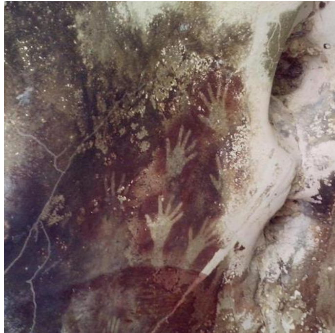
Görsel 1. Leang Tedongnge Mağarası El Şablonları

Endonezya'daki Sulawesi Adası, 45.000 yıldan daha eski olan mağara sanatına ev sahipliği yapmaktadır. Buradaki Leang Tedongnge Mağarası(Görsel 1). hayvan tasvirleri, kırmızı ve dut pigmentleriyle çizilmiş el şablonları (Görsel 2). Tarih öncesi sanatta muhtemelen bilinen en eski anlatı sahnesini içermektedir