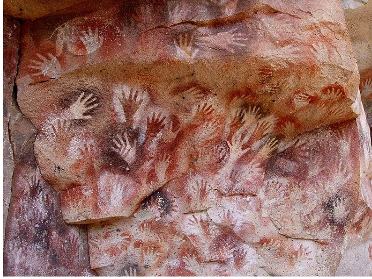
Görsel 6. Cueva De Las Manos (Eller mağarası)

İki binden fazla insan eli şablonu tespit edilen bu mağarada, genellikle sol el şablonunun çıkarılması tercih edilmiştir (Görsel 7). Duvardaki ellerin genellikle sol el olması da ressamın sağ ellerinde püskürtme boruları tuttuklarını düşündürmektedir (Ertuğrul, 2015). Kadın, erkek ve çocuk el izlerinin bulunduğu mağarada, resimlerde kullanılan boyalar çeşitli taşlardan elde edilmiştir. Kullanılan renkler genellikle siyah ve kırmızıdır. Renk tercihlerinin, dönem insanının dinsel ve sosyal algısını yansıttığı düşünülmektedir (Özdemir, 2021:837). Ayrıca bu mağarada olduğu gibi diğer bazı mağaralarda da benzer bir şekilde el tasvirlerinde bazı parmakların eksik olduğu görülmektedir. Bunun sebebinin ne olduğu tam olarak bilinmemektedir. Mağara resimleri arasında el tasvirlerinde sol ve sağ ellerin eşit şekilde kullanılmadığı görülmektedir. Bu farklılığın ne anlama geldiği tam olarak bilinemesi de bu eksik uzuvların her birinin dönemin işaret dili olabileceği düşünülmektedir (Özdemir, 2021:837).