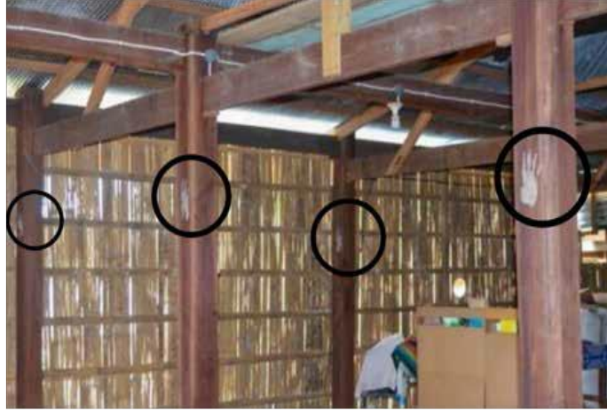
Görsel 4. Mabedda Bola Ritüeli