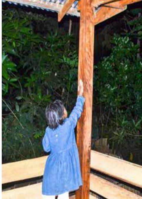
Görsel 3. Mabedda Bola Rituel

Güney Sulawesi’de bulunan el şablonları aynı zamanda yerel bir gelenek olan Mabedda Bola’ya da ev sahipliği yapmaktadır. Mabedda Bola, Güney Sulawesi’deki Bugis- Makassar halkının atalarından miras kalan bir ritüeldir (Görsel 3). Bu ritüelde yeni bir evin, Mabedda Bola’nın törensel açılışı kapsamında düzenlenen “Menre Bola Baru” adı verilen törende, yeni evin direklerine ve duvarlarına el izleri yapılıyor. Bu geleneğin halen devam ettiği bölgede tarih öncesi mağaraların duvarlarında da el kalıpları bulunmuştur. Etno arkeoloji yöntemlerinden biri olan analogi bakış açısıyla el izleri ile el kalıplarının aşağı yukarı aynı formda olduğu keşfedilmiştir. Aralarındaki benzerlikler, günümüz ve tarih öncesi dönem arasındaki aynı davranış kalıplarına işaret eder. Avuç içi baskısı, geleneksel bir evde yaşayan veya belirli bir mağarada düşünülen aile veya grubun sahipliğini işaretlemek içindir. Ayrıca bu el şablonlarının kötülüklerden koruduğuna dair bir inanış olduğu bilinmektedir (Görsel 4) (Permana, Pojoh ve Arifin, 2017, s.713).