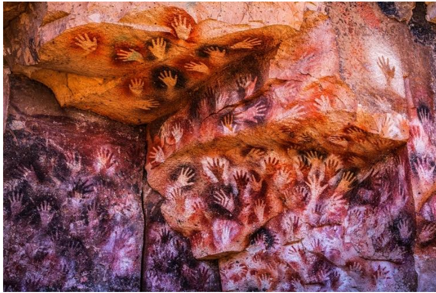
Görsel 7. Cueva De Las Manos (Eller Mağarası).

İki binden fazla insan eli şablonu tespit edilen bu mağarada, genellikle sol el şablonunun çıkarılması tercih edilmiştir (Görsel 7). Duvardaki ellerin genellikle sol el olması da ressamın sağ ellerinde püskürtme boruları tuttuklarını düşündürmektedir (Ertuğrul, 2015). Kadın, erkek ve çocuk el izlerinin bulunduğu mağarada, resimlerde kullanılan boyalar çeşitli taşlardan elde edilmiştir. Kullanılan renkler genellikle siyah ve kırmızıdır. Renk tercihlerinin, dönem insanının dinsel ve sosyal algısını yansıttığı düşünülmektedir (Özdemir, 2021:837). Ayrıca bu mağarada olduğu gibi diğer bazı mağaralarda da benzer bir şekilde el tasvirlerinde bazı parmakların eksik olduğu görülmektedir. Bunun sebebinin ne olduğu tam olarak bilinmemektedir. Mağara resimleri arasında el tasvirlerinde sol ve sağ ellerin eşit şekilde kullanılmadığı görülmektedir. Bu farklılığın ne anlama geldiği tam olarak bilinemesi de bu eksik uzuvların her birinin dönemin işaret dili olabileceği düşünülmektedir (Özdemir, 2021:837).