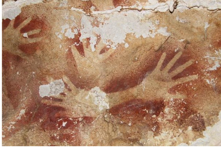
Görsel 2. Güney Sulawesi Adasındaki Mağara Duvarı