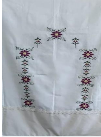
Resim 7 Seccade örneği ( GÜNGÖR ARŞİVİNDEN, 2022).

Siyah etamin üzerine işlenen kanaviçe seccade örneğinde bitkisel motiflerin kullanıldığı farklı desenler kullanılmıştır. Desenler tek tek iğne ve desen iplikleri ile sayılarak el ile işlenmiştir. İşlemesi bittikten sonra ayak kısmının geldiği yer ise siyah farklı bir kumaşla kalın şerit halinde dikilerek kullanıma hazır hale getirmiştir.