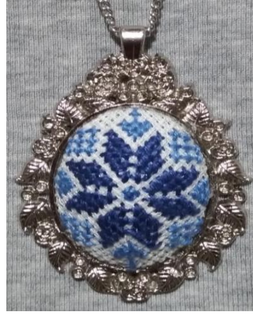
Resim 3 Kolye örneği (Güngör arşivinden, 2022)

Resim 2 deki tablo örneği Fazilet hanımın 15 Demokrasi ve Millî Birlik Günü'ne ithafen tasarlanmış kanaviçe işleme örneğidir. Etamin kumaş üzerine çalışılmış örnekte anlamlı günden kalan görseller kanaviçe işleme tekniği el ile işlenerek üretilmiştir. Resim 3 deki kolye ucunda ise Habibe Çölkadiroğlu çiçek ve elibelinde motifini etamin kumaş üzerine el ile işleyerek kadının gücüne atıfta bulunulmuştur.