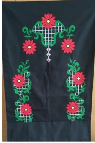
Resim 6 Seccade örneği.

Siyah etamin üzerine işlenen kanaviçe seccade örneğinde bitkisel motiflerin kullanıldığı farklı desenler kullanılmıştır. Desenler tek tek iğne ve desen iplikleri ile sayılarak el ile işlenmiştir. İşlemesi bittikten sonra ayak kısmının geldiği yer ise siyah farklı bir kumaşla kalın şerit halinde dikilerek kullanıma hazır hale getirmiştir.