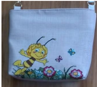
Resim 21 Çanta Örneği ( GÜNGÖR arşivinden, 2022)

Resim 20 de yer alan çanta örneğinin tasarımın sahibi Fazilet GÜNGÖR olup çalışma etamin kumaşı yerine akfil olarak bilinen kumaş çeşidi kullanılmıştır. İşleme tekniği ile bitkisel motifler işlenmiştir. Desen Bezemesinde çiçekler ve yapraklar kullanılmıştır. İşlemesi önce yapılan çanta örneğinin kulpları aynı kumaştan fakat iç kısmında astar olarak ise saten kumaş kullanılmıştır.