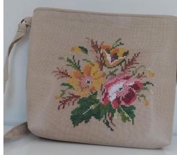
Resim 18 Necibe Şekeroğlu Çanta Örneği

Göz motifinin desene hakim olduğu Resim 17 deki örnekte diğer çanta örneğinde olduğu gibi etamin kumaş üzerine işleme öncesinde yapıldıktan sonra çanta aparatına monte işlemi yapılmış ve günlük eşya olarak kullanıma hazır hale getirilmiştir.