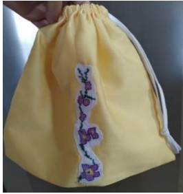
Resim 24 Kese örneği