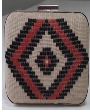
Resim 17 Fazilet GÜNGÖR tasarımı Çanta Örneği

Resim 16 da görseli verilen çalışmada zigzag olarak bilinen motifin farklı renklerle şerifler halinde etamin kumaşı üzerine işlenerek elde edilmiştir. Desen ayrı olarak kumaşa iğne ve renkli iplerle işlenmiştir. Desen işleme biten çalışma çanta aparatına monte edilerek günlük yaşamda kullanılmaktadır. Tasarım kurs usta öğreticisi Fazilet GÜNGÖR'e Aittir.