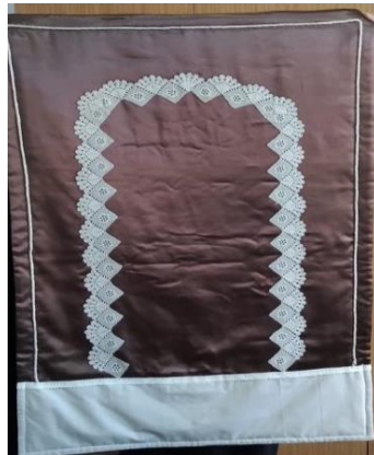
Resim 10 Seccade rneđi (Gngr arřivinden, 2022)