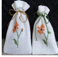
Resim 22 Kese örneği

İçerisine Para, kurutulmuş kokulu gül, çiçek veya bitki konulmak tasarlanan dekoratif süs eşya ürünleridir. Araştırma sürecinde elde edilen örnekler incelendiğinde bazı görülmektedir. Keselerin yapılış amaçlarına göre ölçülerinde farklılık görülmektedir.