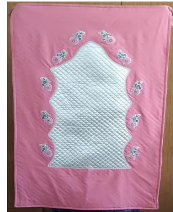
Resim 11 Seccade rneđi (Gngr arřivinden, 2022)

Resim 9-10-11 deki seccade tasarım rnekleri ise OBEM de retilen farklı seccade tasarım rnekleridir. Saten kumař zerine dantel rgs veya farklı kumařların desenleri kesilerek yerleřtirilerek elde edilen tasarım rnekleridir.