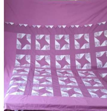
Resim 13 yatak örtüsü örneği Resim 14 yatak örtüsü örneği Resim 15 yatak örtüsü örneği (Güngör arşivinden, 2022). (Güngör arşivinden, 2022). (Güngör arşivinden, 2022).