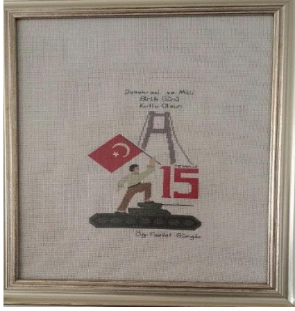
Resim 2 Tablo örneği