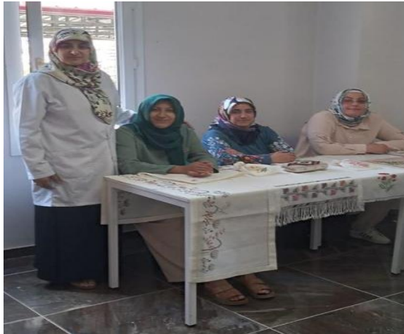
Resim 1 OBEM kanaviçe kurslarından bir kare (Güngör, 2022)

Osmaniye Belediyesi Sanat ve Mesleki Eğitim Merkezi (OBEM) el sanatı kapsamında farklı branşlarda kurslar açan Osmaniye belediyesine bağlı aktivite merkezidir. Kurslarda kanaviçe(işleme), dokuma sanatı, ahşap yakma, keçe, iğne oyası ve ebru gibi gelenekselleşmiş sanatlarımız tanıtılmakta ve uygulanmaktadır. Ortalama her kurs için on beş öğrenci alımı yapılmakta ve her kursta kendi dalına ait sanat branşında yetişmiş usta öğreticilerin eğitiminde yeni ustalar yetiştirilmektedir. OBEM toplumların kültür değerlerinden olan el sanatlarının yaşatılması için yapılan çalışmalara örnek olarak verilen aktivite merkezlerindedir. Son yıllarca ülkemizde hemen hemen her bölgede resmi bir kuruma bağlı olarak açılan bu tür aktivite merkezleri, özellikle de kadınlarda meslek edindirme bakımından önemlidir. Açılan kurslarda edindikleri bilgileri deneyimleri ile birleştiren kadınlarımız meslek sahibi olmanın yanında aynı zamanda uzmanlaşmış oldukları sanatların yeni kitlelere ulaşması ve gelecek kuşaklara miras olarak bırakılması konusunda da önemli rol oynamaktadırlar.