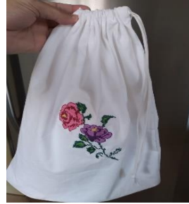
Resim 25 Kese örneği