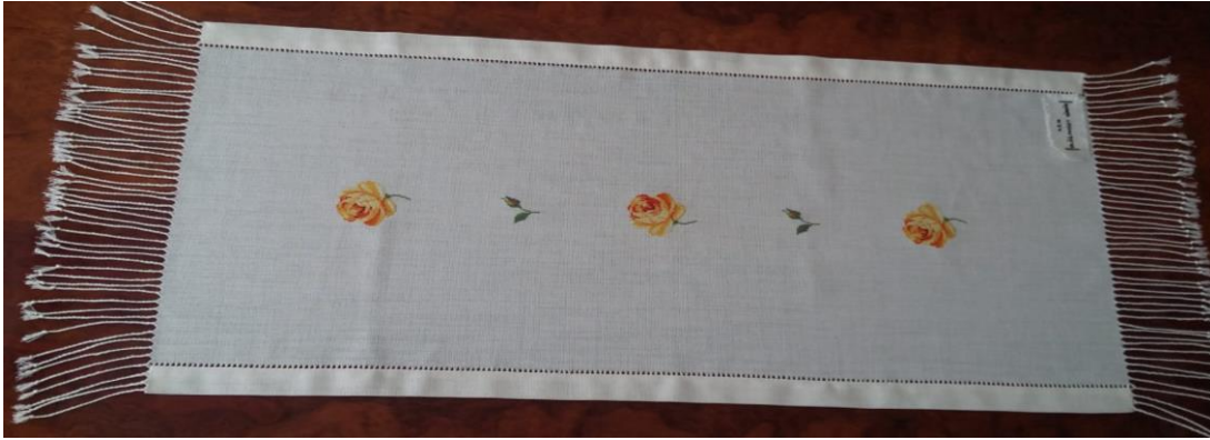
Fotoğraf 2. Çözümleri seyreltilerek üzerine desen işlenen sehpa örtüsü(Kılıç Karatay, 2022)

Etaminden farklı olarak sık dokunan kumaşlarda iğne yardımı ile dokuma iplikleri yatay ve dikey olarak seyrettilerek etamin görüntüsü elde edilmekte ve üzerine işleme yapılmaktadır. Bu tür işlemlerde desenli bölüm diğer kumaştan farklı bir kumaş üzerine işlenmiş gibi görünmektedir. Antep işine teknik olarak benzese de görünüm olarak farklı olan işleme örnekleri de bölgede ilgi görmektedir.