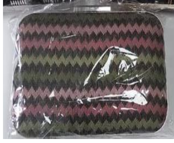
Resim 16 Çanta Örneği

Resim 16 da görseli verilen çalışmada zigzag olarak bilinen motifin farklı renklerle şerifler halinde etamin kumaşı üzerine işlenerek elde edilmiştir. Desen ayrı olarak kumaşa iğne ve renkli iplerle işlenmiştir. Desen işleme biten çalışma çanta aparatına monte edilerek günlük yaşamda kullanılmaktadır. Tasarım kurs usta öğreticisi Fazilet GÜNGÖR'e Aittir.