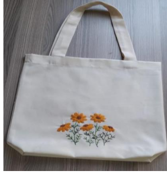
Resim 20 Çanta Örneği ( GÜNGÖR arşivinden, 2022)

Tasarımı Fazilet GÜNGÖR'e ait olan çanta örneği yaygın olarak kot kumaşı olarak bilinen ve halk dilinde denim kumaşı olarak da geçen kumaş üzerine bitkisel motifler işlenerek elde edilen tasarım örneğidir. Resim 19 da çanta örneğinde kumaş olarak daha önce giyim eşyası olarak kullanılan pantolon veya gömleklerin zamanla yıpranması sonucu bazı bölgelerinde deforme meydana gelmiş, deforme olmayan kısımları ise yeniden değerlendirme amacı ile çanta olarak tasarlanmıştır. Çantanın ön yüzüne tasarımı zenginleştirmek adına bitkisel çiçek, yaprak ve dal gibi desen kompozisyonları işleme tekniği ile yerleştirilmiştir.