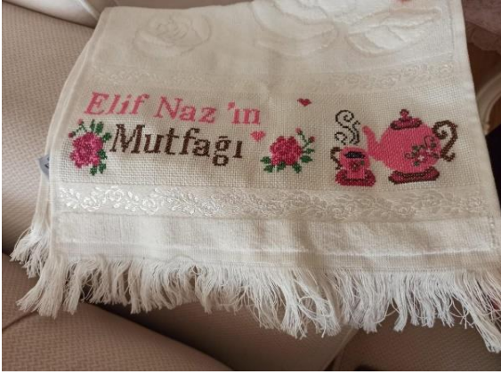
Resim 4 Fazilet güngör'e ait Havlu örneği (Güngör arşivinden, 2022)

Resim 2 deki tablo örneği Fazilet hanımın 15 Demokrasi ve Millî Birlik Günü'ne ithafen tasarlanmış kanaviçe işleme örneğidir. Etamin kumaş üzerine çalışılmış örnekte anlamlı günden kalan görseller kanaviçe işleme tekniği el ile işlenerek üretilmiştir. Resim 3 deki kolye ucunda ise Habibe Çölkadiroğlu çiçek ve elibelinde motifini etamin kumaş üzerine el ile işleyerek kadının gücüne atıfta bulunulmuştur.