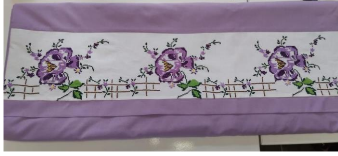
Resim 12 yatak örtüsü örneği.

Çift kişilik yatak örtüsü olarak tasarlanan Resim 12’deki örtü örneğindeki tasarım öncesinde yastık veya yatak örtüsü olarak işlenen etamin üzerine kanaviçe örnekleri şerit halinde kesilip renkli akfil üzerine dikilmesiyle elde edilmiştir. Tasarımda renk bütünlüğünü sağlamak adına işlemede kullanılan desen iplikleri ile akfil kumaş rengi aynı olmasına dikkat edilmiştir. Örtünün desen bezemesinde yer alan kanaviçe işleminin yaklaşık elli yıl öncesinde işlendiği ve ürünün sahibi olan kursiyerin annesinin çeyizinden miras olduğu bilinmektedir. Ürün yeni bir işleve kavuşurken sandık içinde saklanan el emeği ürünlerde gün yüzüne çıkmaktadır.