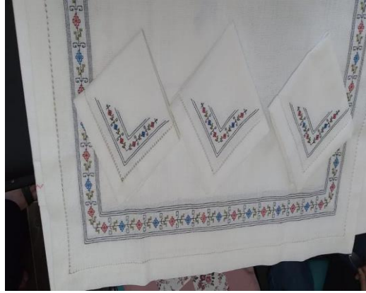
Resim 5 Masa takımı örneği

Havlu kenarlarında tek kenar bölümünde kanaviçe işleme tekniği kullanılmıştır. Özellikle kenarlarında kalın şeritlerin bulunduğu havlular seçilmiş ve bu kalın şeritler işlenerek desenler yerleştirilmiştir. Resim xdeki havlu örneğinde bu tasarımlardan olup ilgi gören tasarım örneklerindedir. Yemek masa örtüsü takımı etamin üzerine yapılan kanaviçe işlemlerin akfil kumaşları üzerine dikilmesi ile elde edilen tasarım örneklerindedir. Her iki tasarımda çeyiz içinde yer alan önemli el emeği ürünlerdendir.