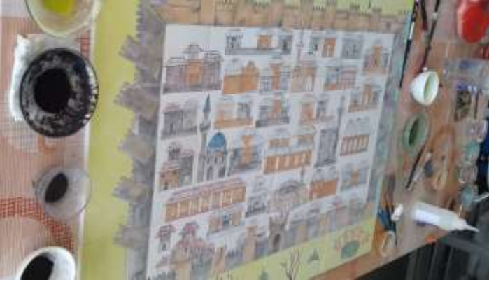
Resim 10. Tahrir ve Boyama Aşamaları

Tahrir boyası ile dış hatları belirlenen desen boyamaya hazır hale getirilir, aynı zamanda tahrir, boyaların birbirine karışmasını önlemektedir.