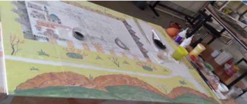
Resim 11. Tahrir ve Boyama Aşamaları

Çini yüzeye aktarılan İznik kent minyatürü konulu çini pano uygulama örneği boyama aşamaları