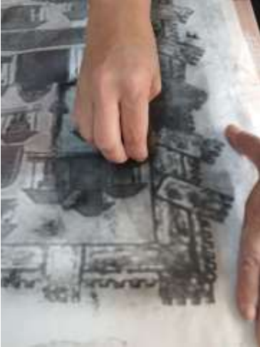
Resim 8. Kömürleme İşlemi

İnce uçlu iğne ile belirli aralıklarla delinen şablon kömürlemeye hazır hale getirilir.