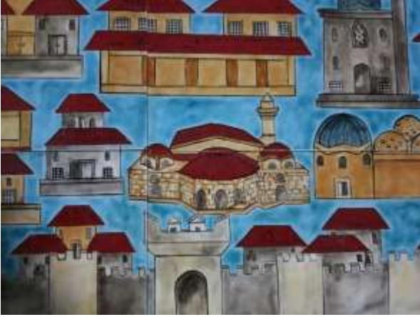
Resim 13.Tahrir ve Boyama Aşamaları

Günümüz İznik Ayasofya Camii'nin fotoğrafından yararlanılarak Matrakçı Nasuh'un minyatürlerinde kullandığı temel kompozisyon teknikleri göz önünde bulundurularak orijinal minyatür tasvirinde yorumlanmıştır (Karşıdan cephe görünümü ve kuşbakışı görünüm).