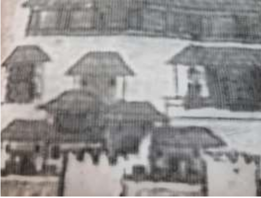
Resim 7. Delinmiş Şablon

İnce uçlu iğne ile belirli aralıklarla delinen şablon kömürlemeye hazır hale getirilir.