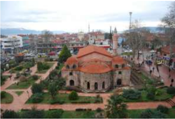
Resim 14. İznik Ayasofya Camii

Günümüz İznik Ayasofya Camii ( M.S.7. yy)