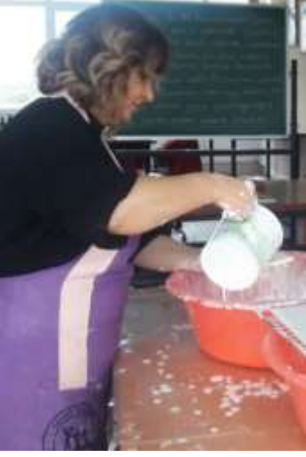
Resim 16. Sırlama İşlemi

Dekoru tamamlanan çini karolar akıtma yöntemi kullanılarak sırlama işlemi yapılmaktadır.