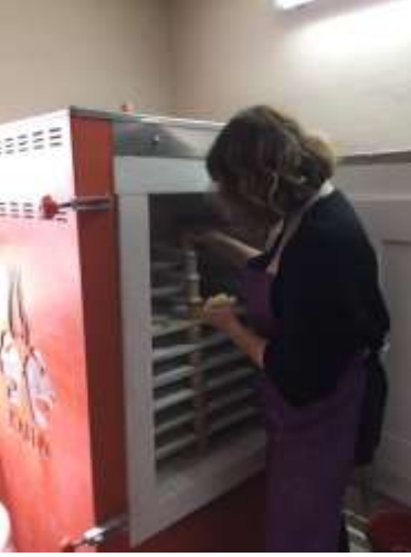
Resim 17. Çini Karoların Fırına Yerleştirilmesi

Sırlanan çini karolar, fırın refrakter malzemeleri kullanılarak birbirine değmeyecek şekilde yerleştirilir.