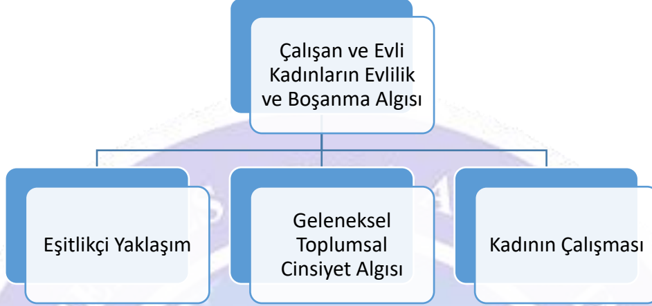
Şekil 2.1: Temalar

işleminin ilk aşaması açık kodlamada veriler baştan sona detaylı bir şekilde okunur benzerlik ve farklılıklarına göre gruplanır. Eksen kodlamada ise elde edilen veriler araştırmanın temel sorunsalı çerçevesinde birbiri ile ilişkilendirilmiştir. En son aşama seçici kodlamada ise araştırmanın temel soru cümleleri çerçevesinde kodlar arasındaki ilişki ortaya çıkarılmış ve temalar ortaya konulmuştur: