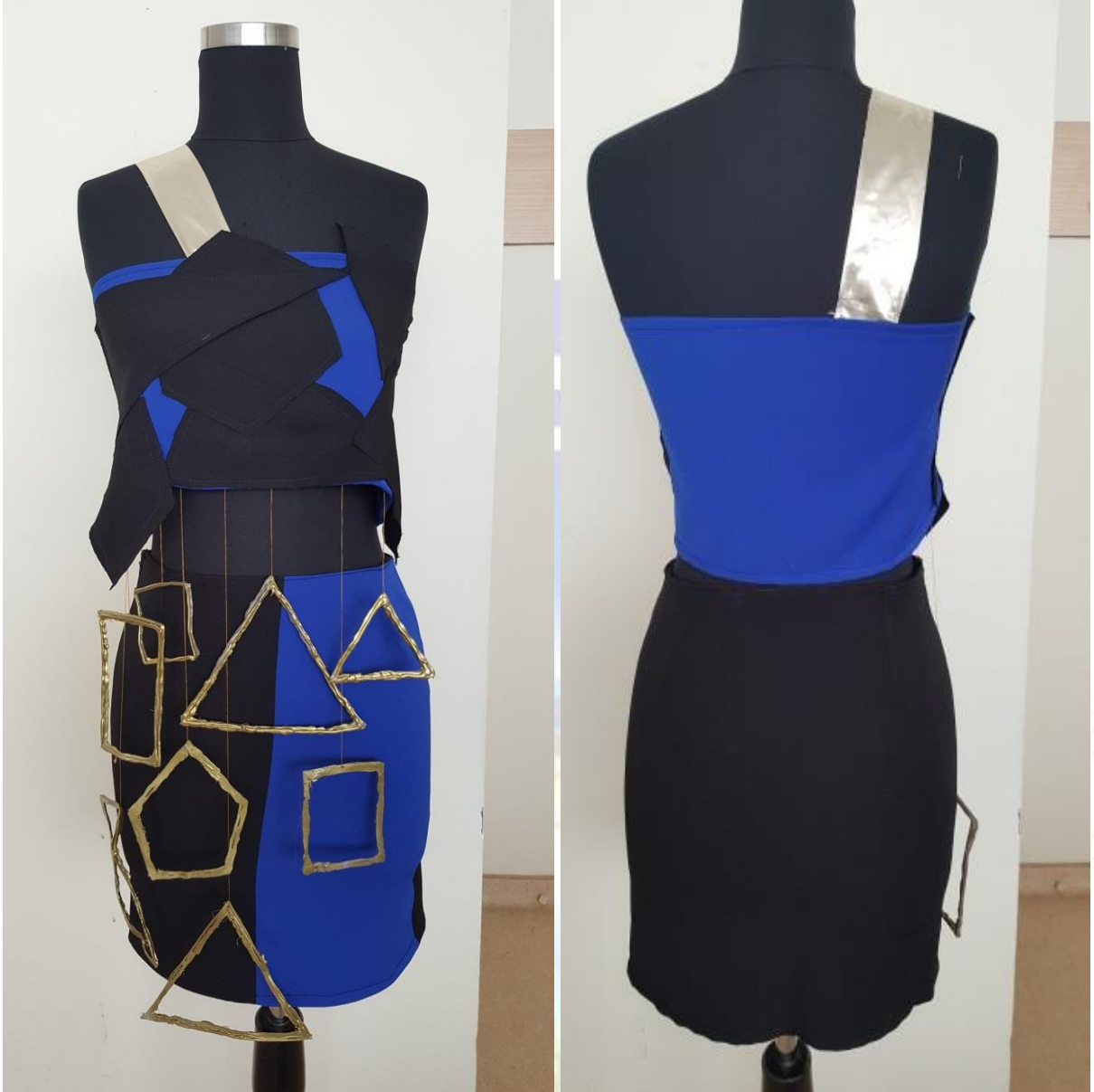
Figür 11. a-) Model 6 Önden Görünüş