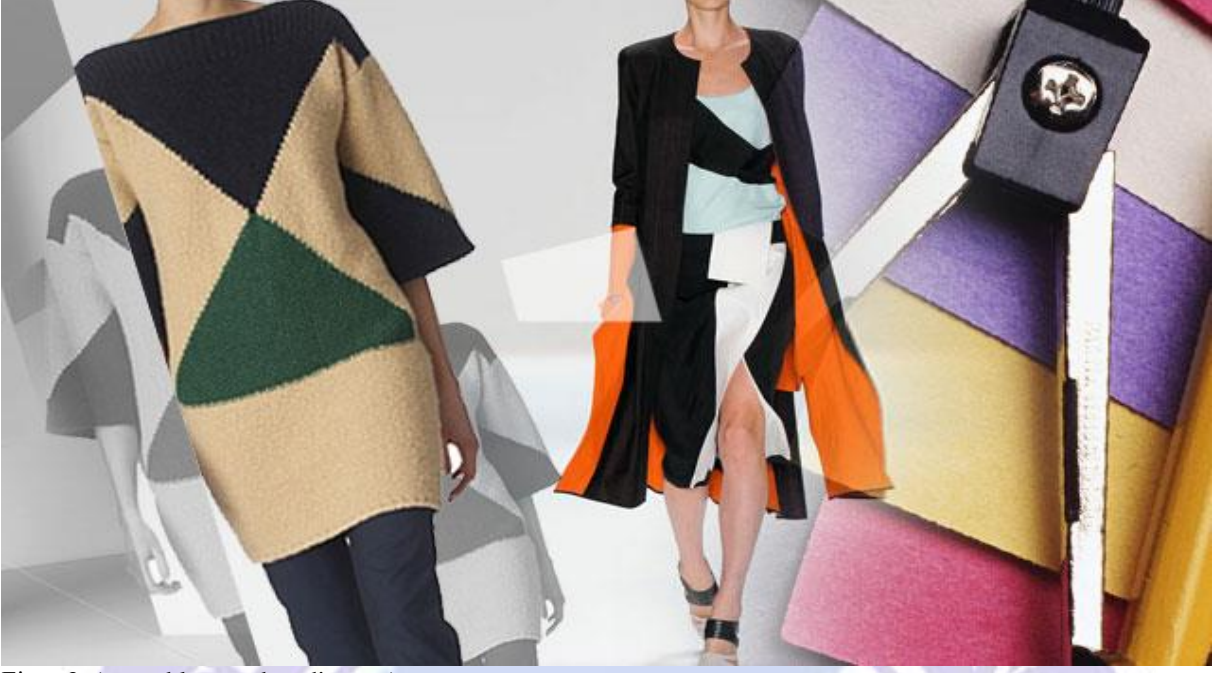
Figür 3.