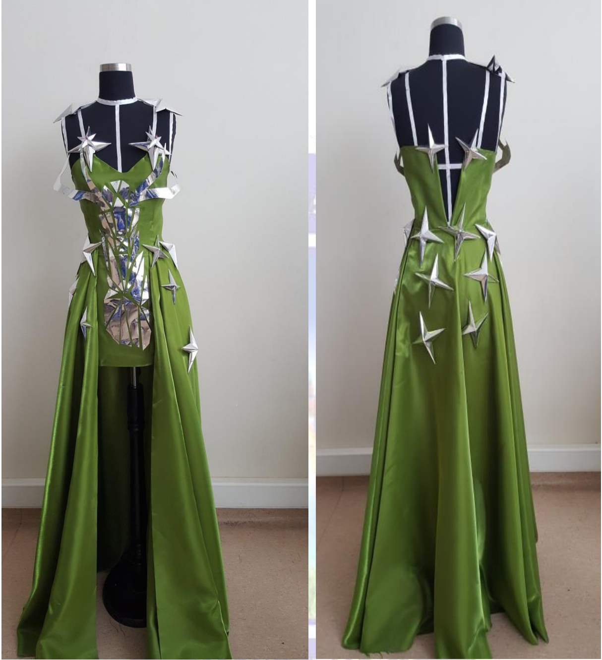
Figür 9. a-) Model 4 Önden Görünüş