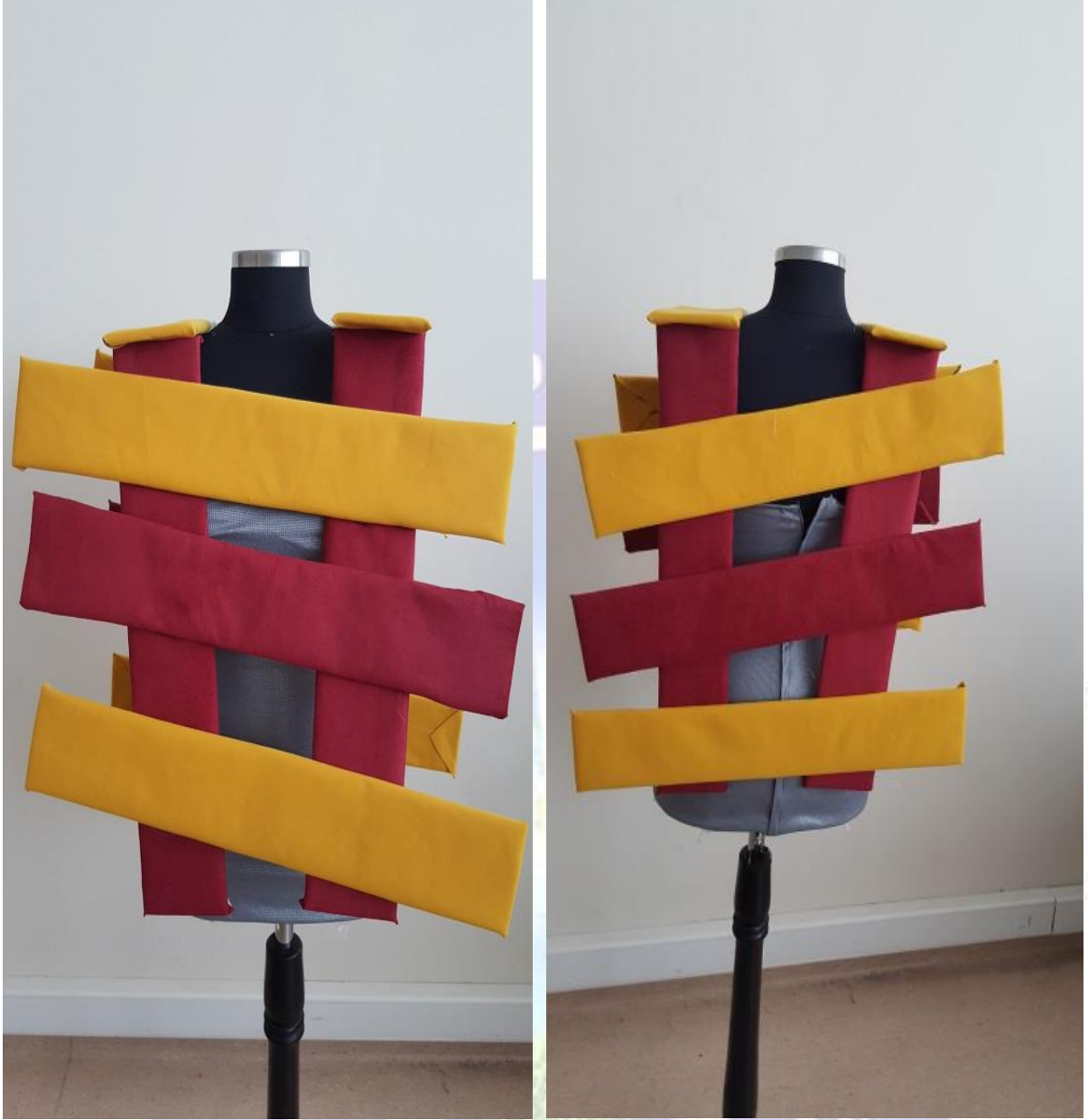
Figür 8. a-) Model 3 Önden Görünüş