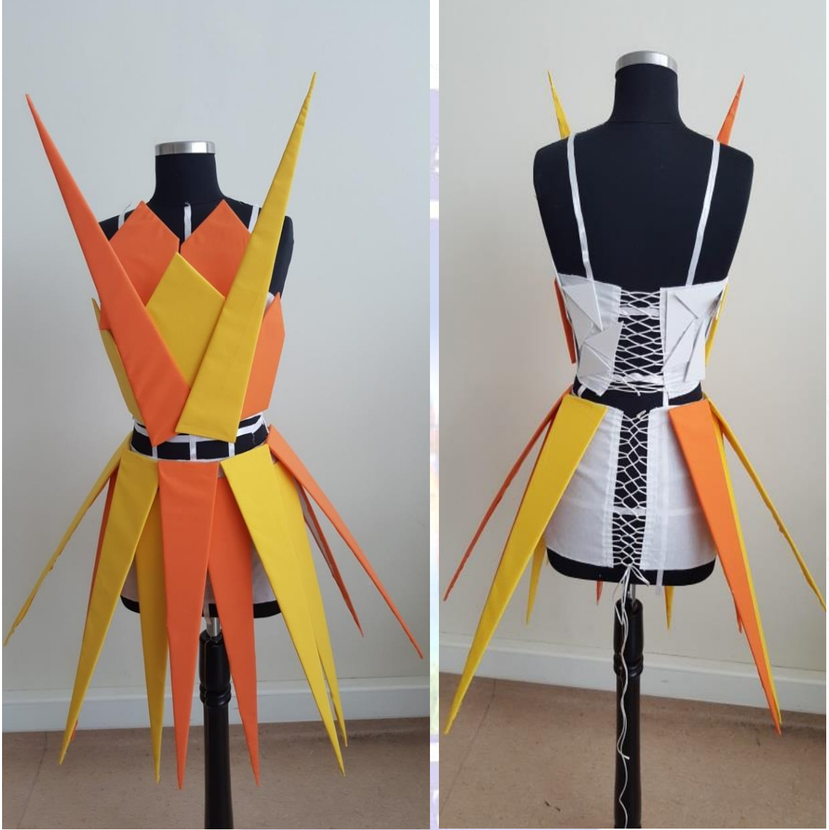
Figür 6. a-) Model 1 Önden Görünüş