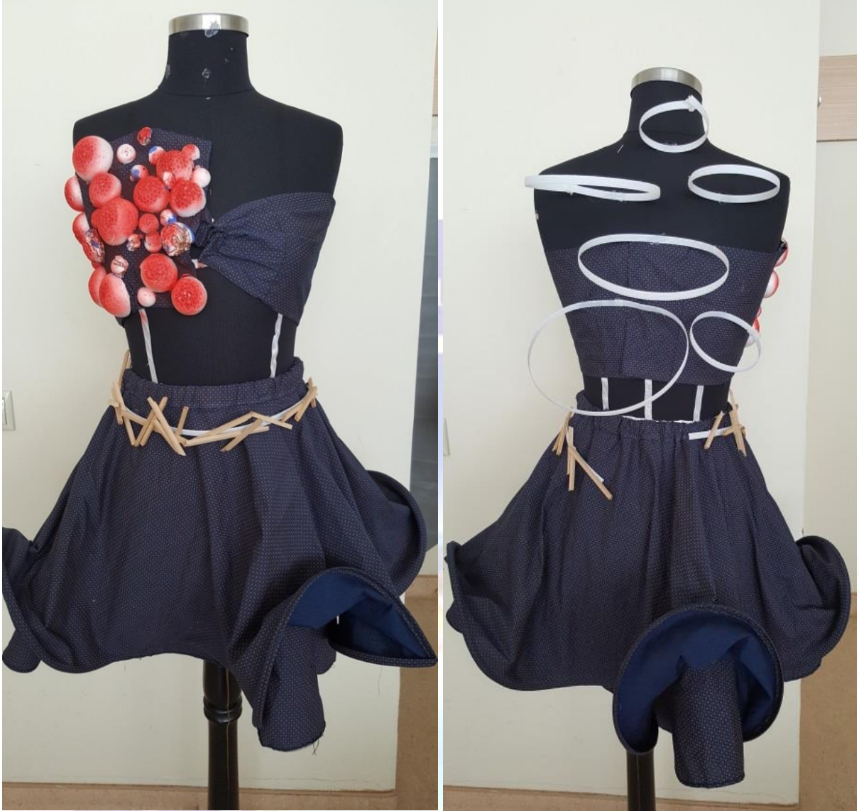
Figür 13. a-) Model 8 Önden Görünüş