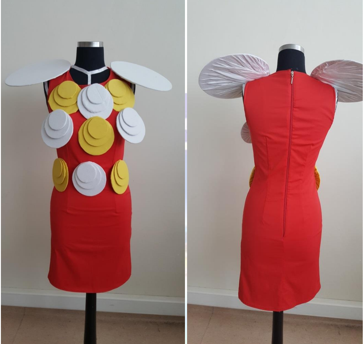
Figür 14. a-) Model 9 Önden Görünüş