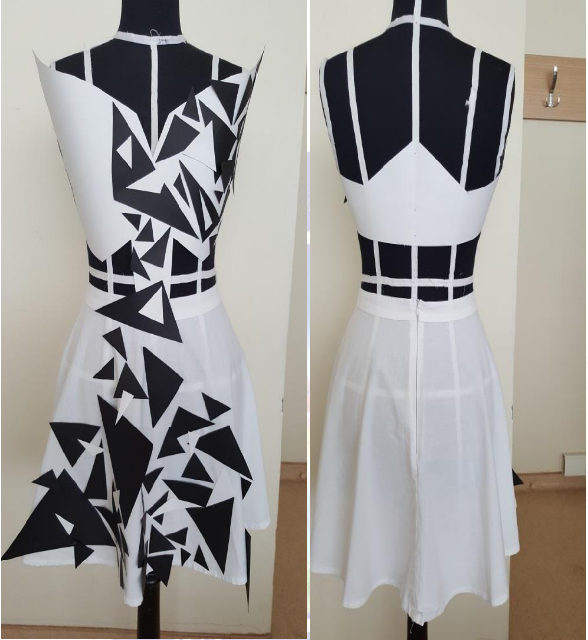
Figür 12. a-) Model 7 Önden Görünüş