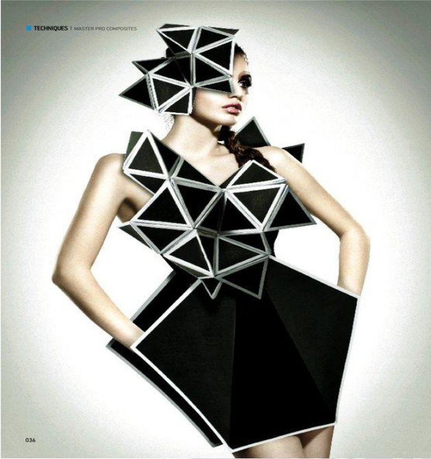
Figür 4.