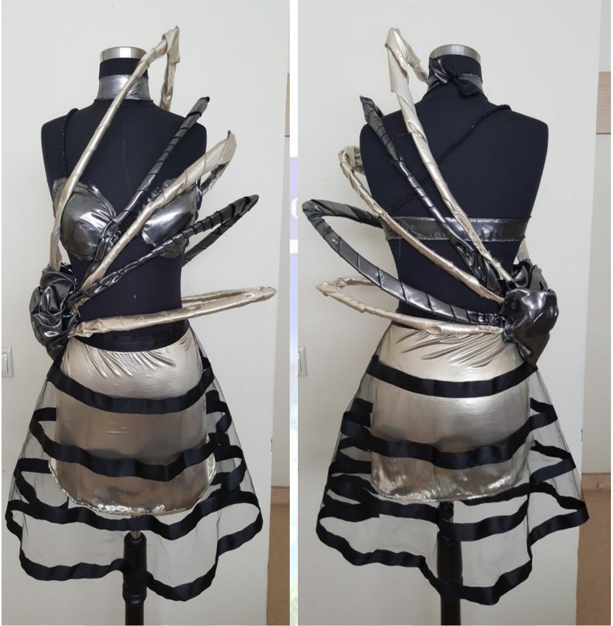
Figür 10. a-) Model 5 Önden Görünüş