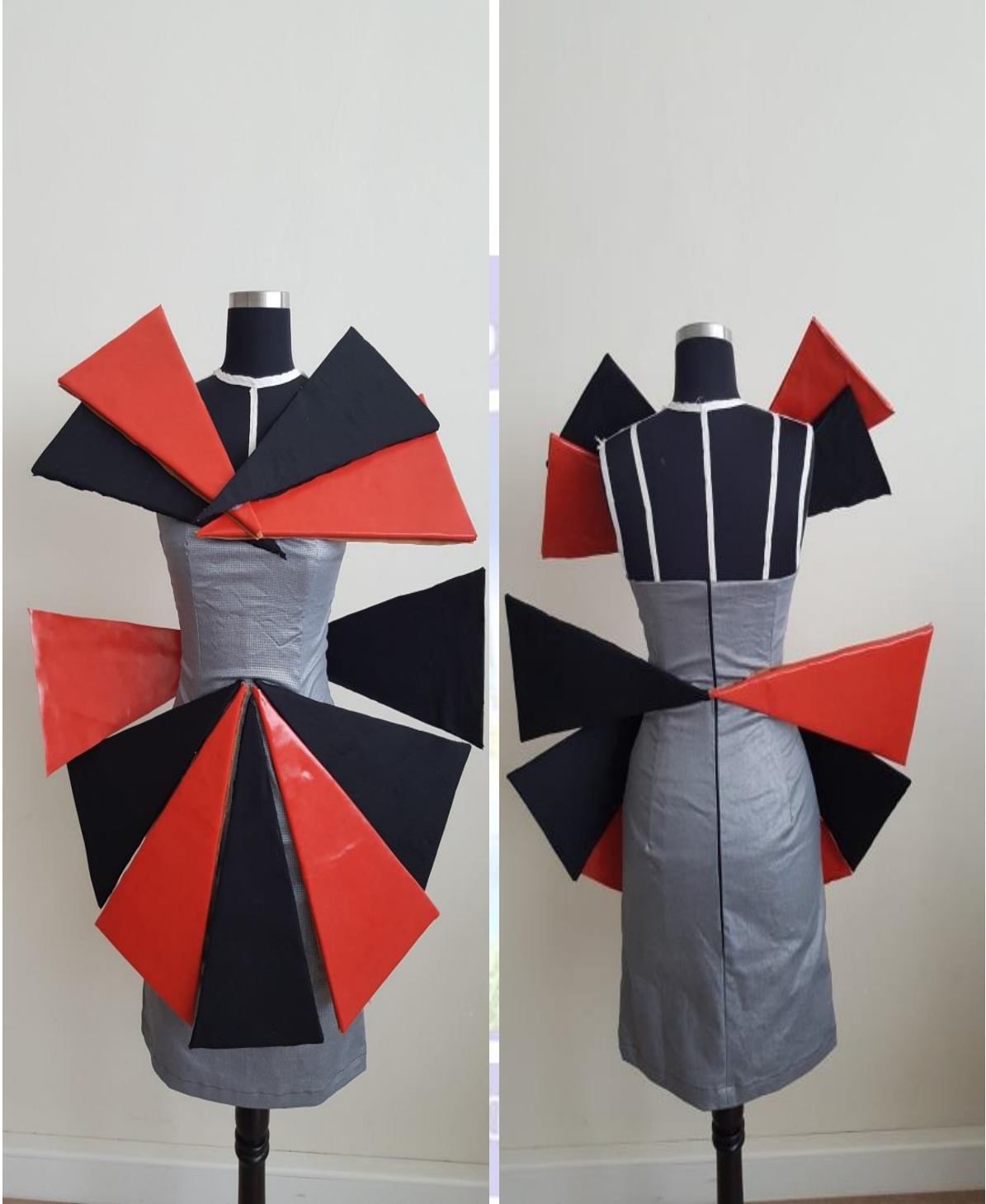
Figür 7. a-) Model 2 Önden Görünüş