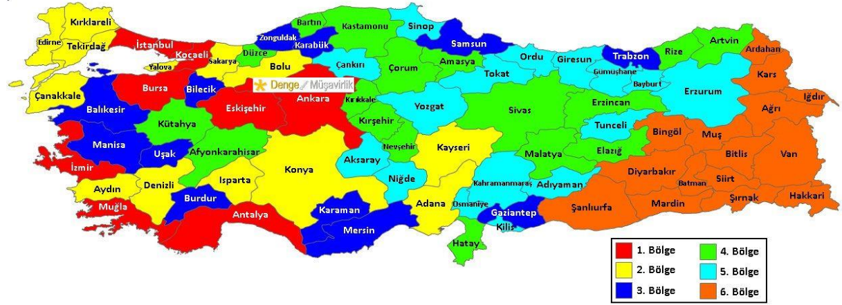
Şekil 3. Yatırım Teşvik Bölgeler Haritası

Bölgesel teşvik uygulamasının amacı; sosyo-ekonomik gelişmişlik sıralamasına göre daha az gelişmiş olan illerin üretim ve ihracat potansiyellerini artırarak iller arası gelişmişlik farkını en az düzeye indirmektir.