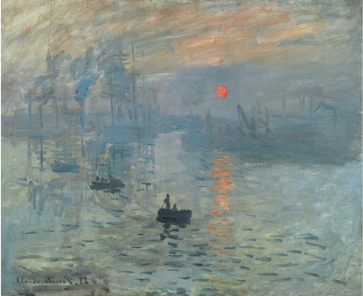
Resim 1: Claude Monet, Gündoğumu/izlenim, T.Ü. Y.B. 48X63 cm, 1872, Marmottan-Monet müzesi, Paris

Sanatçıların günlerce hatta aylarca üzerinde çalışıp yaptıkları bir portre veya manzarayı, makine çok kısa bir sürede yapabilmektedir. Bu nedenle sanatçılar bir makinenin yapamadığını yapmaya yönelmek durumunda kalmışlardır. Bunun bir sonucu olarak, dönemin tablolarında fırça darbeleri ve yer yer formlarda bilinçli bir deformasyon görülmektedir. Bunun yanında renkleri doğadaki canlılığı ile kullanmaya çalışma ve konu seçiminde ciddi bir değişim söz konusudur. Empresyonist anlayışın en önemli eserlerinden biri olan ve aynı zamanda bu akıma ismini vermiş olan, Claude Monet'in "Impression" adlı eseri incelendiğinde hızlı üretime ayak uydurmaktan neyin kastedildiği açık bir şekilde anlaşılacaktır.