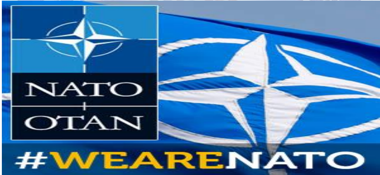
Tablo 3: NATO resmi Facebook sayfası 11

Tablo 3 NATO resmi Facebook sitesinde yer alan fotoğrafı göstermektedir. Ayrıca fotoğrafın alt kısmında yer alan videoda özgüvenle yürüyen NATO üyesi devletleri temsilen askerler, kadınlar ve erkekler yürümektedir. Onlar yürürken üye devletlerin bayrakları videonun üst kısmında geçmektedir.