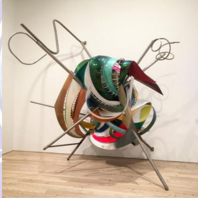
Frank Stella, K.81 (2009)

Stella, Foster'ın söylediklerini onaylayan türden yaptığı K serisi çalışmalarıyla mekan, malzeme ve algı üzerinde bilinçli bir şekilde oynar. Kaidesiz olarak yerle bütünleşen ya da duvara monte edilen bu çalışmalar sanal bir görüntü vermektedir. Parlak renkli malzemeler ve metal çubuklar bükülmeler ve uzantılar şeklinde iniş çıkışlar meydana getirir. Duvara monte edilenler ise duvardan fıskıran bir ritme sahiptir. Dalgalı hareketlerle zarif bir biçimde kendi içinde kıvrılarak dönüp dururlar. Biçim ve renk çeşitliliği ile bilindik anlamda minimal izlerin biraz ötesine geçerler. Yine sadedirler fakat ilk çalışmalarından farklı olarak izleyici de seyretmesi keyifli nesnelere dönüşürler. Stella bu çalışmalarına teknolojiyi de dahil eder. Bilgisayarda yaptığı projelerini tasarıma dönüştürür. Teknolojiyi çalışmaları için kullanmak esas itibarıyla Stella'nın daha en başından itibaren yeniliklere ve deneyselliğe yönelik tutkusundan dolayı önemli bir detaydır. Stella bu sayede basit geometrik anlatımdan gittikçe görsel olarak karmaşıklaşan bütünsel yapılar elde etti.