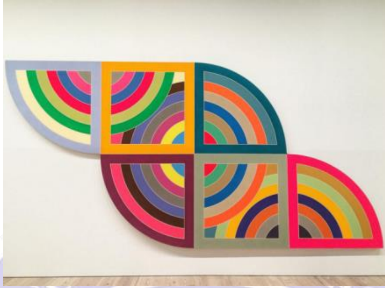
Frank Stella, Harran II (1967)

Stella, illüzyon ve çağrışımın yerine tekrarı, kişisel olmayı ve simetriyi koymaktadır. Zikzaklar biçiminde simetrik çubuklardan oluşan birbirine eklenen çalışmalarının temelini oluşturmuştur. Daha sonraları ise üç boyutlu özel nesnelere diyetebileceğimiz yapıtlarını üretmeye başlamıştır.