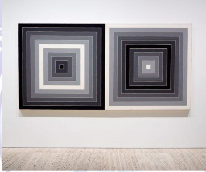
Frank Stella, 'Untitled' (1965)

Stella yapıtlarının hemen hepsinde karşılaştığımız metalik renkli şeritlerle yaptığı siyah ve beyazlardan oluşan çalışmalarında izleyiciyi çalışmayla baş başa bırakır. İzleyiciyin yüzeyin, ötesine gitmesine izin vermez. Bu türden çalışmaları duygusal yoğunlukta bir şeyler bulma olanağını en aza indirir. Bu anlamda Andy Warhol'la benzer. Warhol gibi Stella'da olup bitenin yüzeyde olduğu gerçeğini hiçbir karmaşa yol açmadan ve tüm açıklığıyla gösterme çabasındadır.