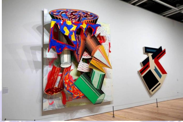
Left: Gobba, zoppa e collotorto , 1985; Right: Chodorow II , 1971

Sanatçı çalışmalarını bir aşama daha ileri taşıyarak ne resim ne de heykel kategorisine sokamayacağımız amorf formlar halinde üretmeye başlamıştır. Bu çalışmalar bazen mekanın içerisinde geometrik hareketlerle kendini tekrarlamış bazen de izleyiciye doğru fırlayan üç boyutlu bir hal almıştır. Sistematik tekrara dayalı bu çalışmalar adeta birer endüstriyel ürün gibiydi.