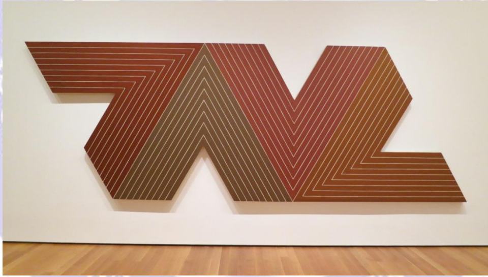
Frank Stella, Empress of India (1965)

Stella, illüzyon ve çağrışımın yerine tekrarı, kişisel olmayı ve simetriyi koymaktadır. Zikzaklar biçiminde simetrik çubuklardan oluşan birbirine eklenen çalışmalarının temelini oluşturmuştur. Daha sonraları ise üç boyutlu özel nesnelere diyetebileceğimiz yapıtlarını üretmeye başlamıştır.