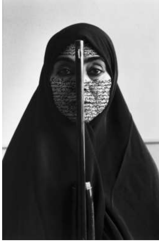
Resim: 2.7. Shirin Neshat, İsyankar Sessizlik (Rebellious Silence)

Doksanların sonlarında sanat dünyası daha küresel hale gelirken video, afiş tasarımı gibi tasarım öğelerinde özgün yerel tasarımlar keşfedildi. İranlı Shirin Neshat'ın bu dönem işleri bunlara birer örnektir.