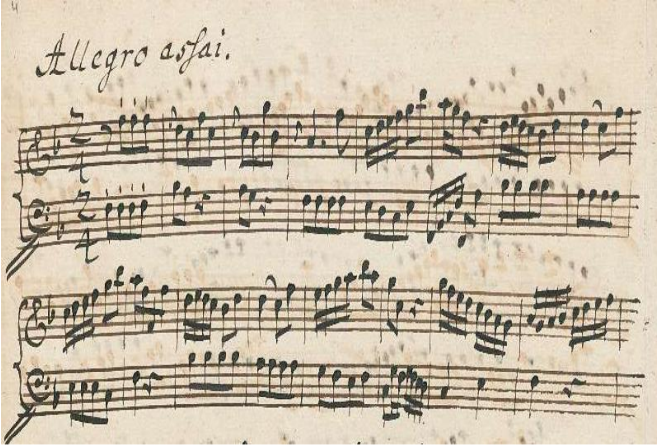
Şekil 3. № 116. Sonat (F dur) 3. Hisseden bölüm

Aynı zamanda, ikinci bölümdeki ana tonaliteye geri dönüş (röpriz), iki bölümlü biçim algısından üç bölümlü röprizli bir forma dönüştüren ana temanın tekrarını yansıtmaktadır. Tarihte Barok bipartit bileşimin içsel karmaşık ve olumsuz durumları Klasik sonat formunun doğmasına neden oldu. Eski iki bölümlü eserlerin biçimlenmesinin çoğu İtalyan bestecilerin eserleri ile ilgilidir. Bu tesadüfi değildir, çünkü ana temayı esas tonalitede tutan “ilave” fikri İtalyan returnel 30 formundan alınmıştır. Eğer XVII. yüzyılın sonu XVIII. yüzyılın başlarında bipartit’te tematik röprizli temalardan az sayıda bahsetmek mümkünse, XVIII. yüzyılın ortalarına doğru bunu İ.A.Hasse, J.J.Quanz, Prusyalı Friedrich, B.Galuppi, L.Leo, N.Porpora, J.-J.Mondonville’nin eserlerine yansıtarak bir stil şekline gelmiş halini görüyoruz. Bipartit’in her iki türü Friedrich’in sonatlarında bulunur: hem tematik röprizli (çoğunlukla finallerde) ve onun geleneksel Barok varyantında (özellikle ilk “Allegro”da) (Симонова, 1999:23–25).