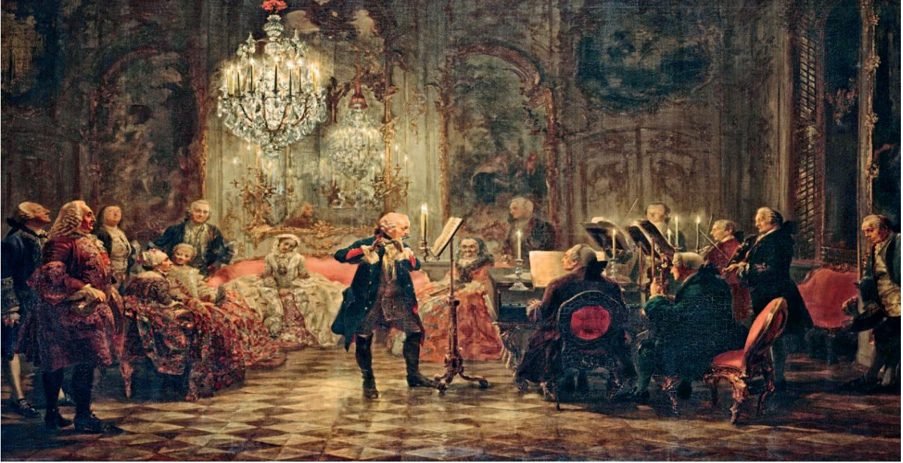
Şekil 1: Büyük Friedrich’ın “ Sans – Souci’de flüt konseri. (Ressam Adolf von Mezzel 1880 – 1852 yıllar)

döneminin hükümdarı modeli oldu. Kralken kendi metinlerinin bazılarını sadece “Sans – Souci 17 ’li filozof” diye imzalardı (Пчелов, http://imslp.org/wiki/Flute_Sonate , 2012:86).