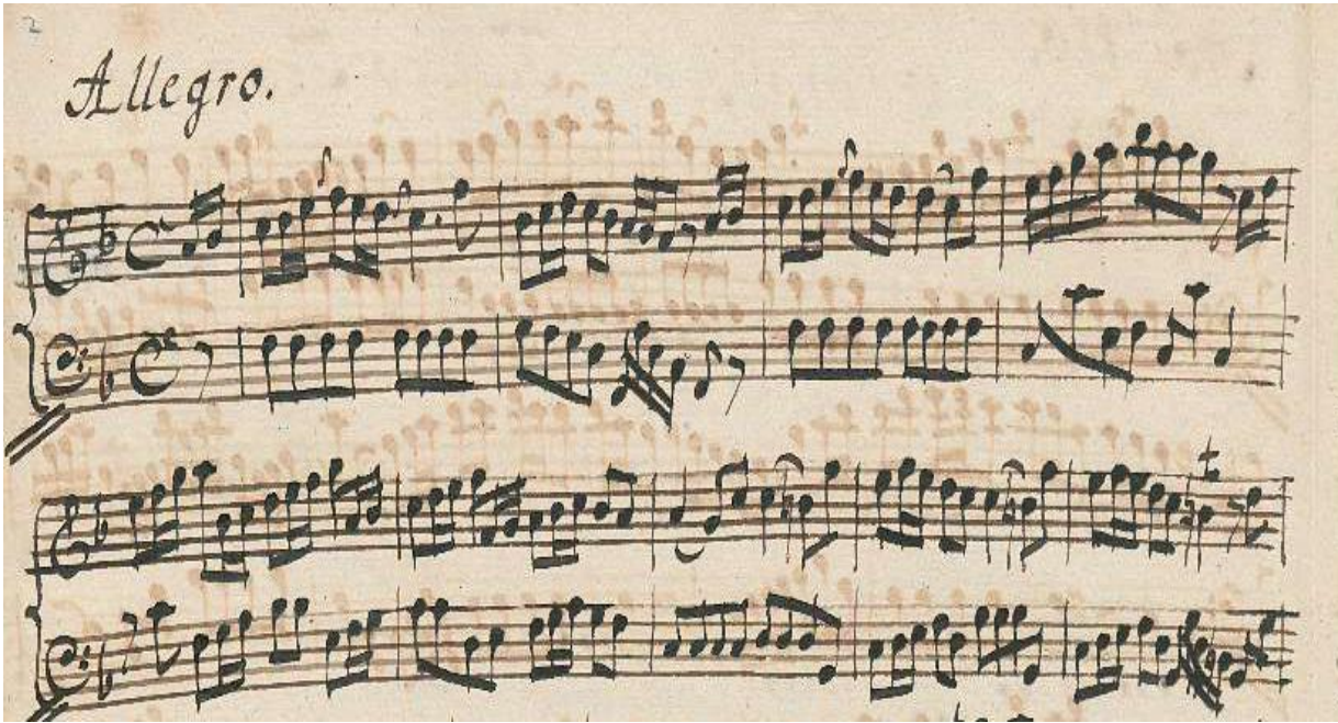
Şekil 2. № 116. Sonat (F dur) 2. Hisseden bölüm

"Yenileme" stiline bir diğer önemli göstergesi de formun yorumlanmasıdır. Friedrich, tüm sonatlarının hızlı hisselerinde eski iki hisseli forma 28 istinad eder, Barok müziğinin en yaygın kompozisyon modellerinden birine. Söz konusu final Allegro 'sunda besteci "Galant styl" a has form çözümünü kullanır. Birinci ve ikinci hisselerin ilk bölümlerinin belirgin simetrisi, geleneksel T – D 29 tonalite oranında saklanılır. Hisselerin son bölümlerinin simetrisi ("sonat kafiyeye" olarak adlandırılır), sadece üç ölçülü yapının transpozisyonu ile gösterilmiştir (Качмарчик, 2007, 13).